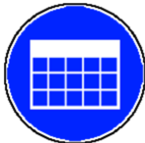
RÉPERTOIRE DES ANALYSES