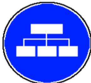
PRESENTATION DES LABORATOIRES