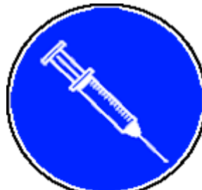
ACTES DE PRÉLÈVEMENTS