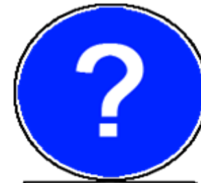
UTILISATION DU RÉPERTOIRE DES ANALYSES