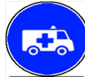
ORGANISATION ET HORAIRES DES NAVETTES