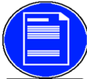
REEMPLIR UN BON DE PRESCRIPTION