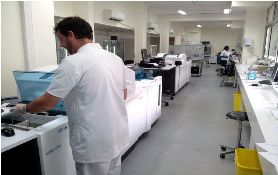
Laboratoire du CHAR